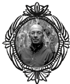
JORGE VOLPI (1968, CDMX).

Ha publicado diez novelas, entre ellas Las Rémoras (1996), Un siglo tras de mí (2004), Fricción (2008), La mujer del novelista (2014), Demencia (2016) y Nudo de alacranes (2019). También es autor de cinco poemarios y seis libros de crítica literaria.